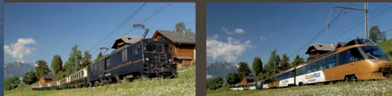
Zweisimmen ← GoldenPass Classic / GoldenPass Panoramic → Montreux