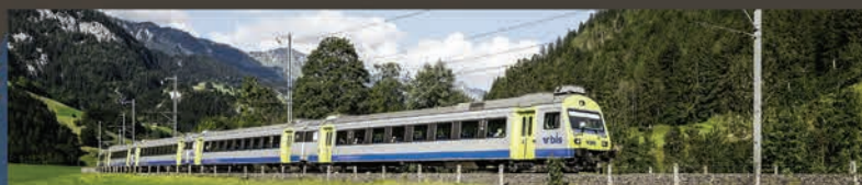
Interlaken ← BLS RegioExpress → Zweisimmen