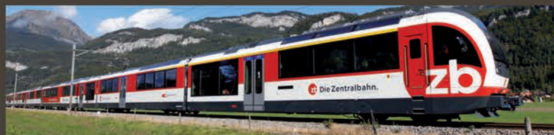
Luzern ← Luzern-Interlaken Express → Interlaken